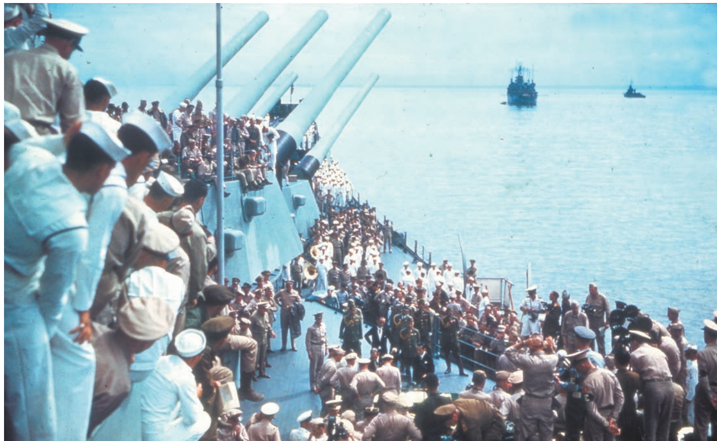
Auf der USS Missouri wird die japanische Kapitulation unterzeichnet.

Wenige Stunden, bevor Nagasaki zerstört wurde, marschierte die Rote Armee in die Mandschurei ein. Die Japaner hatten auf die Vermittlung der Sowjetunion beim Friedensschluss gehofft. Stattdessen hatte Außenminister Molotow dem japanischen Botschafter am Abend zuvor im Kreml – unter Bruch eines noch bestehenden Neutralitätspaktes zwischen Japan und der Sowjetunion – die sowjetische Kriegserklärung übergeben. Die japanischen Soldaten leisteten einige Stunden Widerstand, wichen