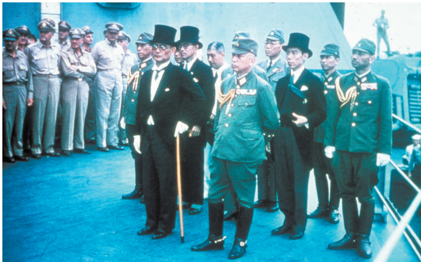
Die japanische Delegation unter Führung des neuen Außenministers Shigemitsu (mit Stock).